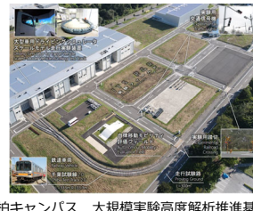
柏キャンパス 大規模実験高度解析推進基盤