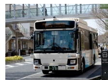
東京大学柏キャンパスへつくばエクスプレス柏の葉キャンパス駅間などで運行